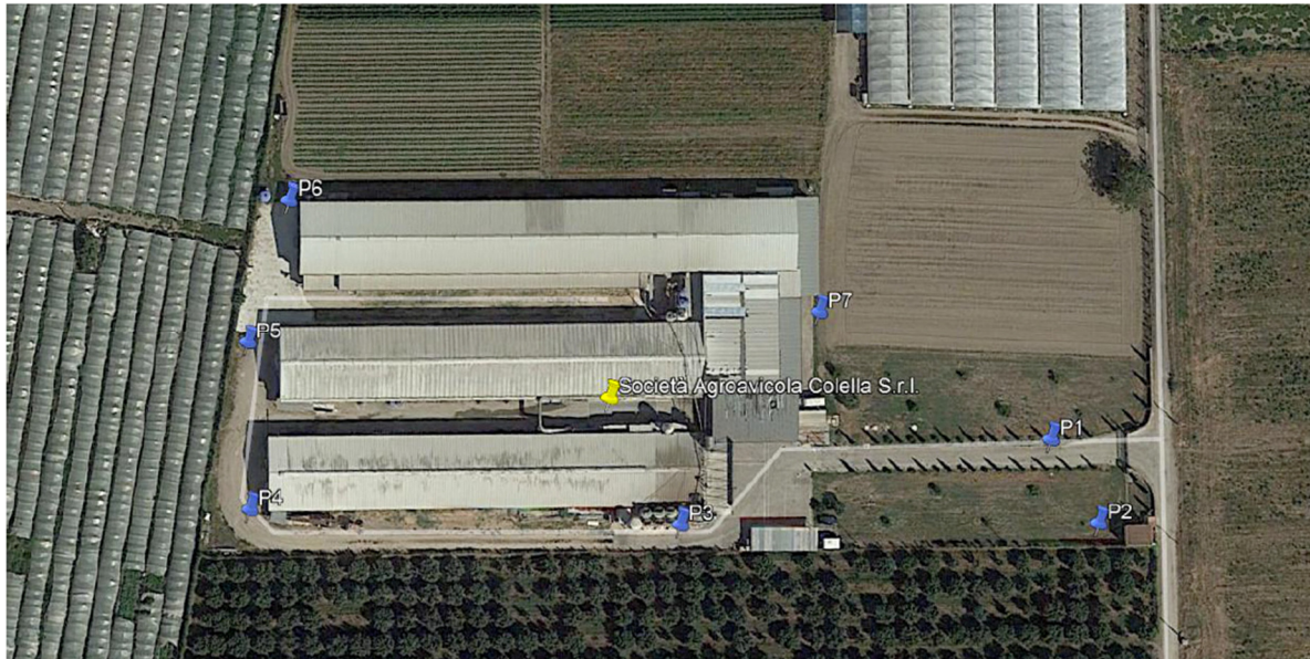
Figura C1 – Postazione di misura delle emissioni sonore.